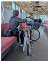
「サイクルトレイン」※