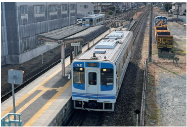
地元住民の貴重な移動手段