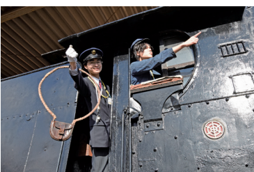
機関車に乗り込んで鉄道員になりきる