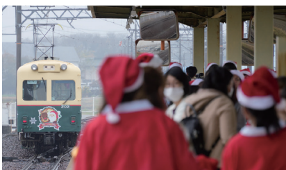
「クリスマストレイン」※