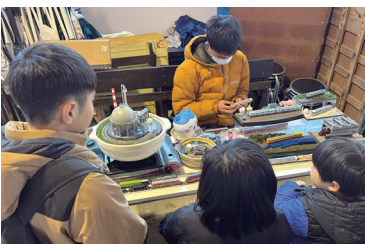
模型スペースの周りには少年が集まる