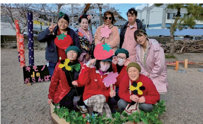
イベント活動にて※