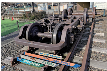
「日永」駅の「スリーゲージモニュメント」