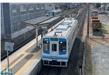
地元住民の貴重な移動手段