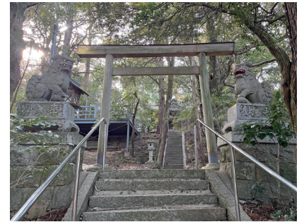
大市神社の鳥居と狛犬

の狛犬の間に、長い石段が続いています。「左手奥には、軽トラックが通れる坂道がありますので、階段が苦手な方はこちらからどうぞ」とのこと。「大市神社は、延喜式に載る古い由緒のお社で、もとは別な場所にありましたが、慶長5(1600)年の関ヶ原の戦いに関連した戦乱で焼失し、この地に祠を建てて再建したといわれています」。石段を上り終え、拝殿前で神様にご挨拶。すると「ここにはあまり知られていない小さな狛犬さんがいるのですよ」と、前田さん。拝殿の左手をめぐって本殿の横に行き板垣