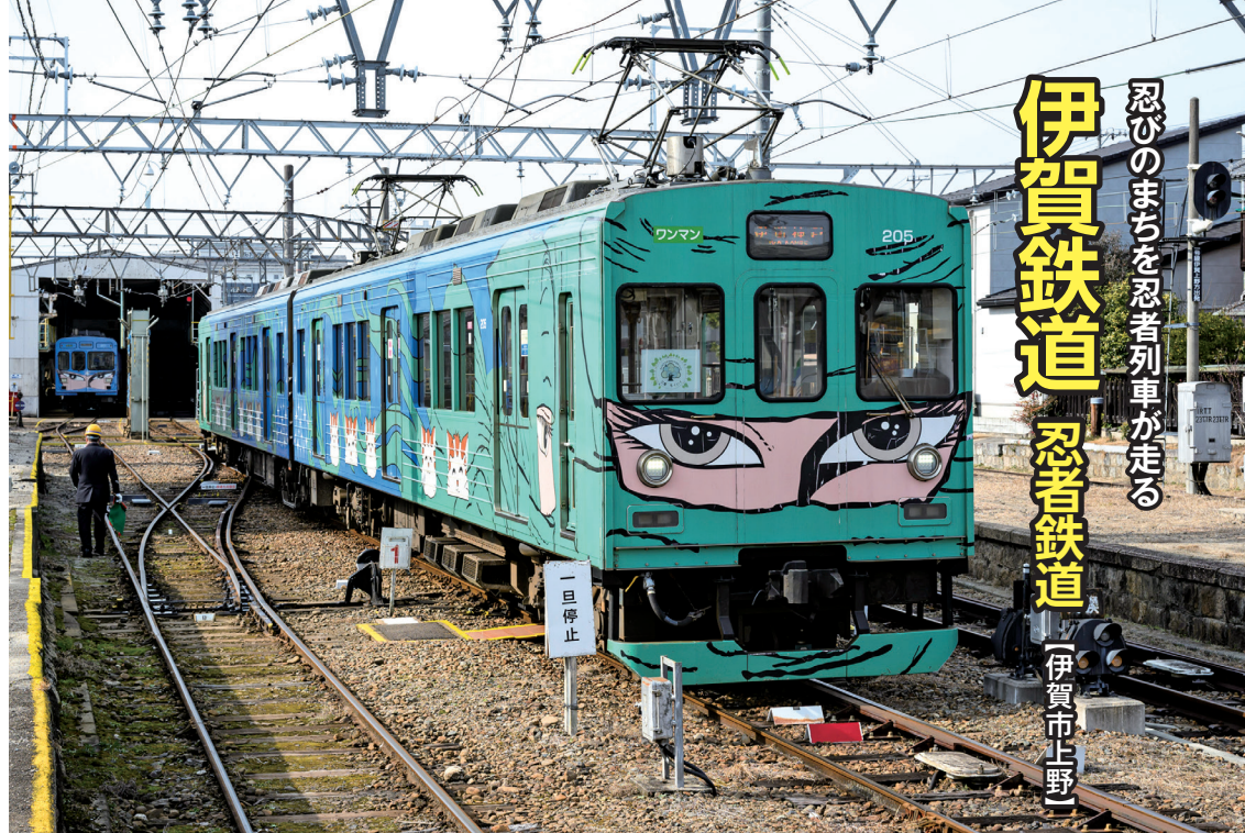
忍者列車の横にはかわいいネコのイラストが ©松本零士／零時社

古い家並みが残る伊賀の町を、忍者列車が走ります。鋭い目つきで、前傾姿勢で走る忍者を思わせ、強いインパクト。大正ロマンを感じさせる駅舎やレンガの跨線橋などのレトロな風景と絶妙なコントラストです。「忍者列車が登場したのは平成9（1997）年からで、漫画家の松本零士さんのデザインです。青・緑・ピンクの3色の忍者列車があり、緑色は木育トレイン」となっていて、車内に三重県産の杉