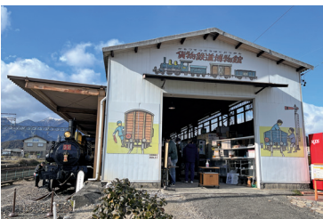
横溝 英一氏のイラストが楽しい外観

「特定非営利活動法人 貨物鉄道博物館」事務局 （三岐鉄道株式会社内） TEL 059-364-2141