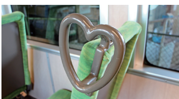
デザイン性と機能性を兼ね備えた「ハート型の持ち手」

れ、幻想的な雰囲気を楽しめます。平成31(2019)年に導入された「シースルー列車」は、床面の一部を透明化することで、枕木、ナローゲージの車輪が動く様子や、「日永」駅では、日本で唯一のナローゲージ分岐点を上から眺めることができ、鉄道ファンの心を掴んでいます。また、「デジタル駅スタンプ」やポイントラリー、乗車体験会、カフェ列車など、地域に密着したさまざまなイベントが開催され、利用促進だけでなく地域活性化の基盤も担っています。また、四日市市ふるさと応援寄付金の返礼品として行っている「1日駅長体験」や「貸切列車」、高校入学試験当日の