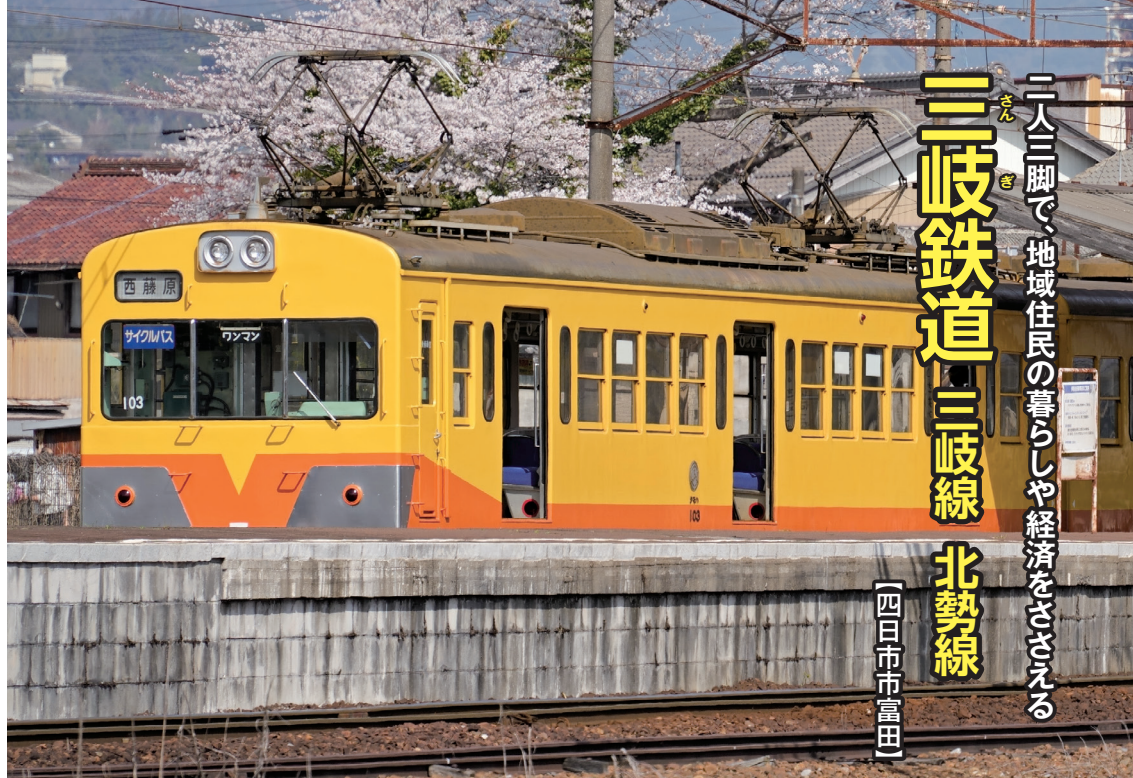
桜満開のころの三岐線「伊勢治田(はった)」駅※

令和3年に開業90周年を迎えた「三岐鉄道株式会社」は、現在、三岐線と北勢線の2路線を運営しています。このうち、三岐線の旅は「近鉄富田」駅から始まります。3番線ホームから発車した途端、ゴトンッ、ゴトンッという音とともに、学生たちの元気で明るい声に包まれました。近くに高等学校があり、通学の足として重宝されています。しばらくの間、