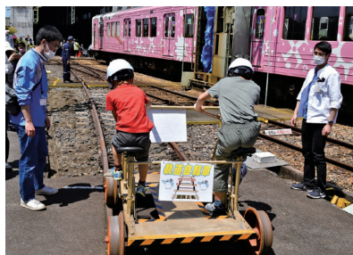
線路上を走る軌道自転車※