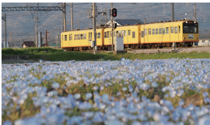
地域住民にも鉄道ファンにも愛される北勢線※