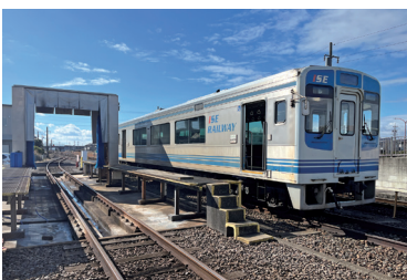
4両を所有している