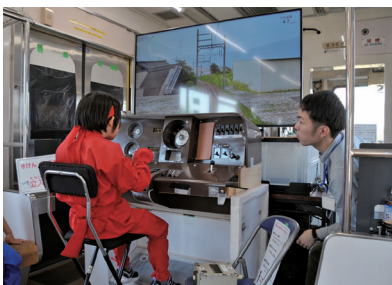
運転シミュレーション※