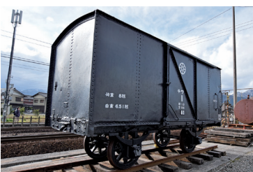
「テワ1型1号」など貨車も多数