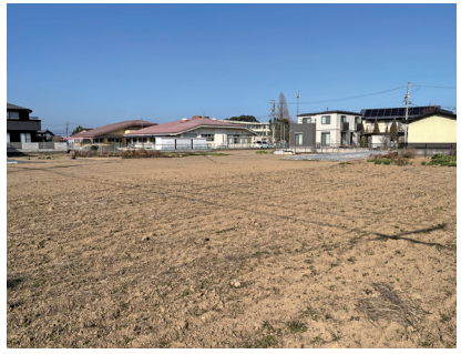
土器などが見つかった「ゆふけ遺跡」