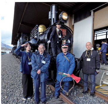
鉄道が大好きなボランティアスタッフたち

性たち。「現在の運営は、すべてボランティアのスタッフと寄付で行われています。制服姿の人たちも、私たちもボランティアスタッフで、服や模型も私物なのですよ。」