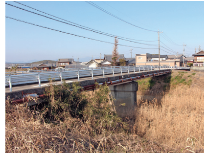
通称・松島橋を渡る