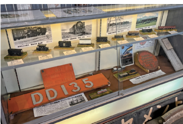
館内には多彩な展示も