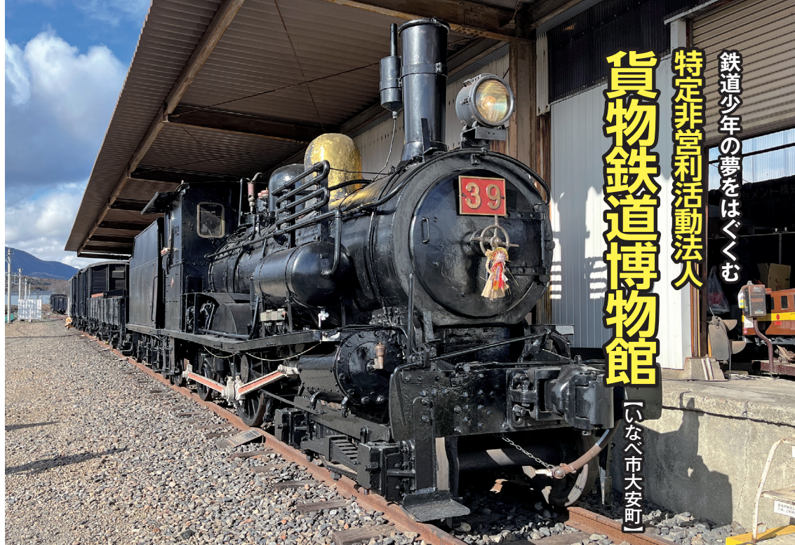
明治から昭和まで活躍した英国製のB4型39号蒸気機関車

三岐鉄道三岐線にガタンゴトンと揺られ「丹生川」駅に降り立つと、駅舎隣の広場には、大勢の人が集まっています。この日は一か月に一度の「貨物鉄道博物館」の開館日。キッチンカーが何台も並び、子ども連れのファミリーや中高生らしい若者たちなどの鉄道ファンが三々五々楽し気に語らって、お祭りのようににぎわっています。