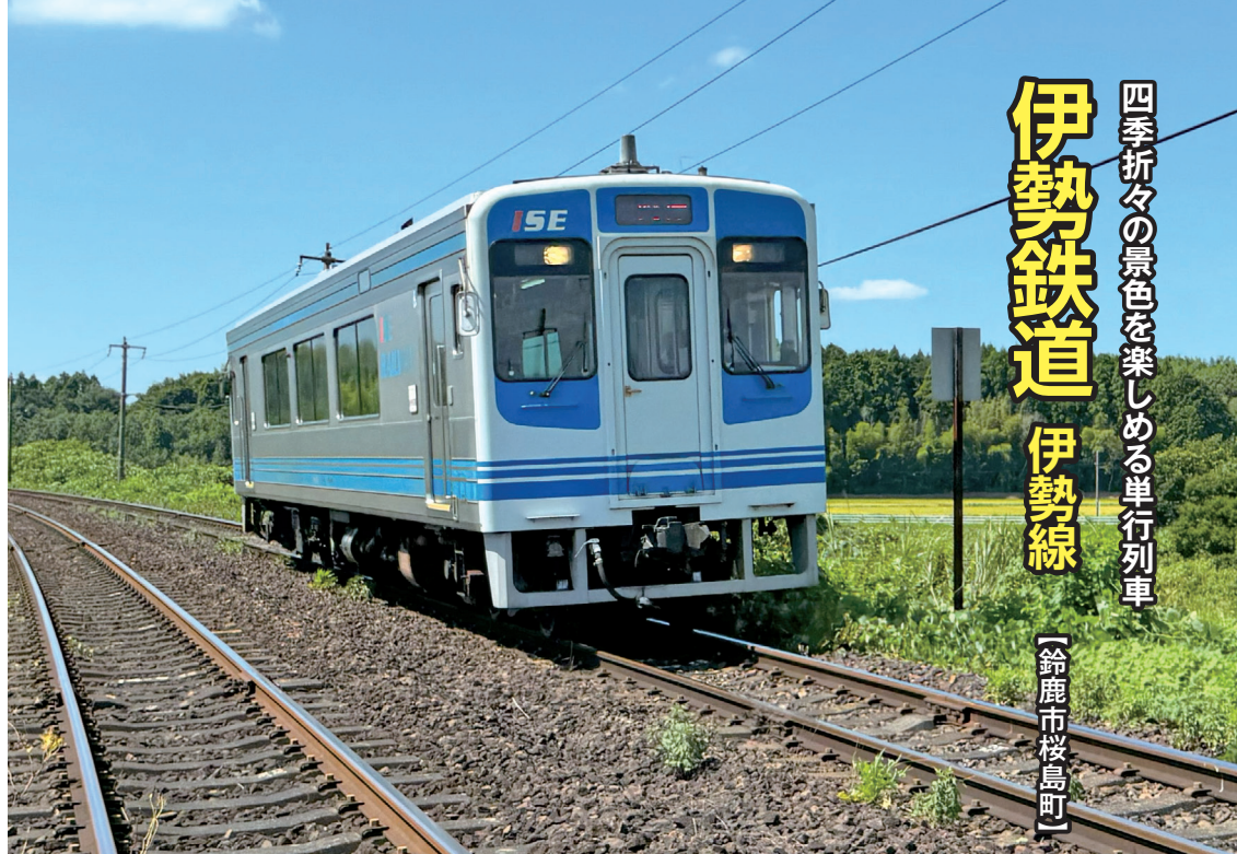
のどかな田園の中を一両で走る*

田園風景の広がる伊勢平野を走る一両の列車。「伊勢鉄道」は昭和62(1987)年に開業し、来年40周年を迎えます。国鉄の民営化にともない廃止対象路線となっていた旧国鉄伊勢線を引き継ぎ、三重県をはじめとする自治体と民間企業が出資して設立された第三セクターの鉄道会社です。路線は「河原田」駅から「津」駅までの22.3キロメートル。河原田と津を合