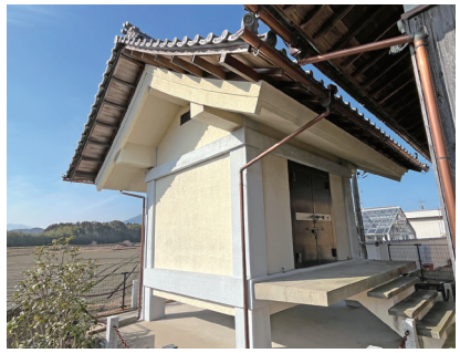
毘沙門天立像の収蔵庫