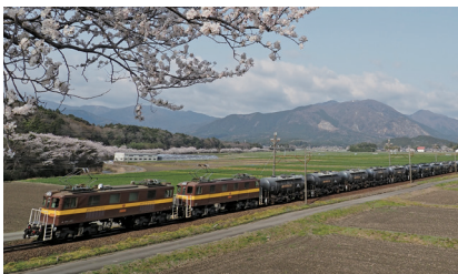
地域の資源を運搬する貨物列車※