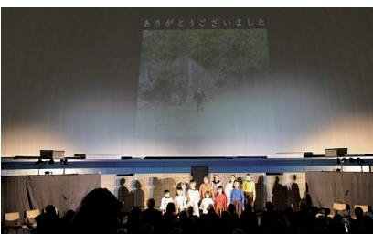
20周年記念公演「鈴鹿のはじまり」※

監督の映画「埋もれ木」の撮影が平成16（2004）年5月から3か月間にわたり鈴鹿市で行われました。翌年の上映をきっかけに、その撮影に関わった一部のメンバーで「今後何か出来ないか？」と、平成17（2005）年に結成したのが始まりです。設立当時の鈴鹿市では演劇に親しむ機会が少なく、芝居を演じる楽しさや創る楽しさ、観る素晴らしさを沢山の方々に知ってほしいと思ったのです。鈴鹿市の市の花「サツキ」を劇団名に付けました。