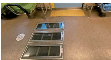
「シースルー列車」車内※