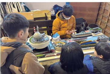
模型スペースの周りには少年が集まる