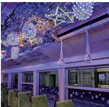
「イルミネーション列車」車内※