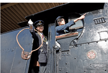
機関車に乗り込んで鉄道員になりきる