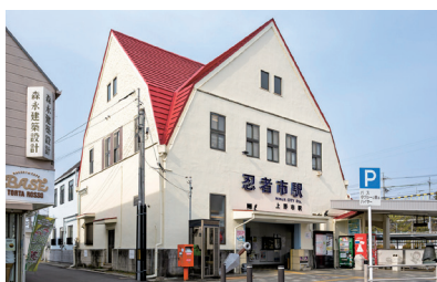
大正時代に建った「上野市」駅の駅舎

の中心部を通って近鉄「伊賀神戸」駅を結び、市民の足としても、観光に來られる方々にも親しんでいたれています。通勤や通学のほか、インバウンドの観光