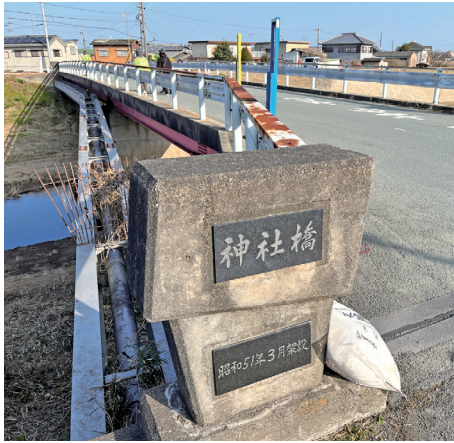
穴倉川に架かる神社橋