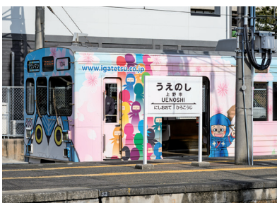
フクロウの忍者「ふくにん」の列車