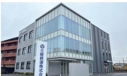
「三岐鉄道株式会社」本社