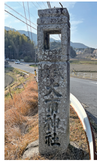
大市神社の常夜灯

の間からのぞくと、社殿の足元に小さなかわいい狛犬が座っていて、ほのぼのとした気分がさせてくれました。