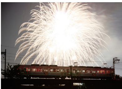
「花火鑑賞列車」で絶景を※

客の中には、忍者列車に乗ることを目的に來られる方も多いのだとか。「忍者列車から、忍者の装束に身を包んだお客さまが大勢降りてくる、というようなことは頻繁にありますよ」とのこと。伊賀市が世界的にニンジャのまちとして知られているのが実感されます。