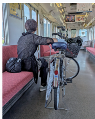
「サイクルトレイン」※