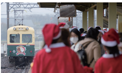
「クリスマストレイン」※