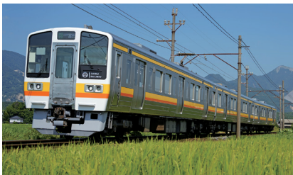
麦畑の中を縫うように走る三岐線※