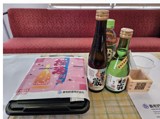
日本酒とおつまみ弁当※

市町で設立された「一般社団法人養老線管理機構」ですと教えてくれるのは、「養老鉄道株式会社」鉄道営業部総務企画課の