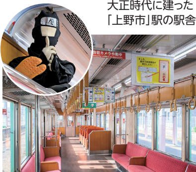
木育トレインの網棚には小さな忍者が