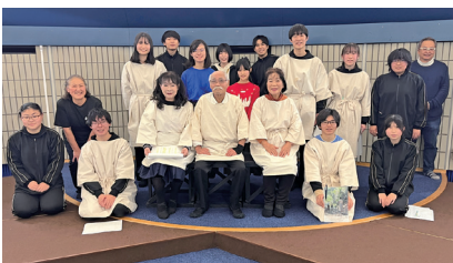
20周年記念公演関係者の皆さん