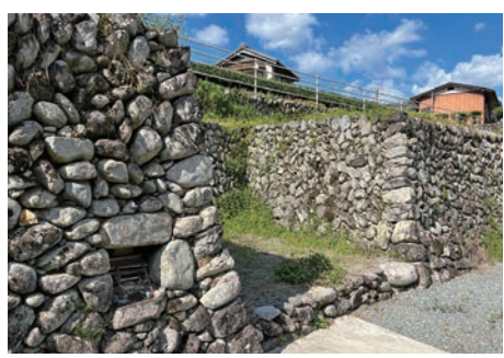
美しい石垣が点在する

今回のコースは、166号にある「東村」バス停からスタート。まずは上流方向に進みます。青い深野大橋の手前に、左に分岐する道がありますので、これを曲がって、下流方向へ。この道は旧