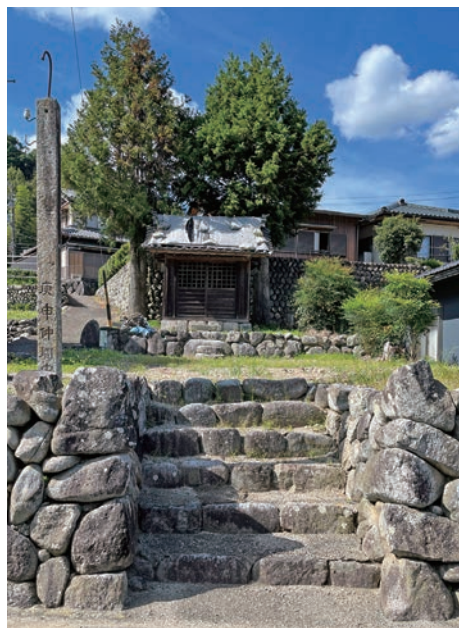
庚申堂のある石垣