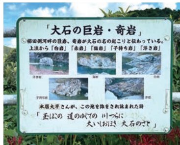
岩の名前が書かれた案内板

川が大きく左にカーブしていく途中に、歩道が川に張り出した部分があり、ここからの景色は絶品。赤岩・白岩・猫岩・浮岩など、岩の名前などを記した案内板が設置されていますので、ゆっくり見比べてください。