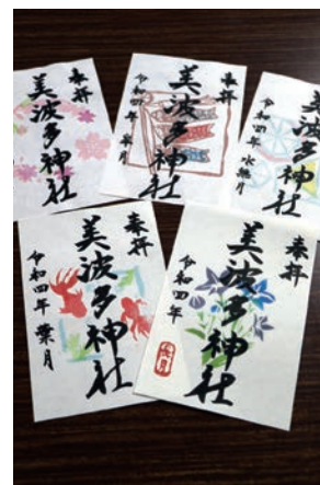
月ごとの花々で彩も美しい