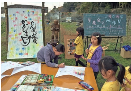
「水沢かかし祭り」の様子※