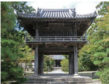
寛永18(1641)年建立の山門