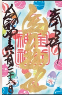
令和4年葉月(8月)の御朱印・夏祭り