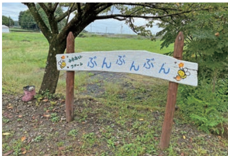
「ふれあいファームぶんぶんぶん」