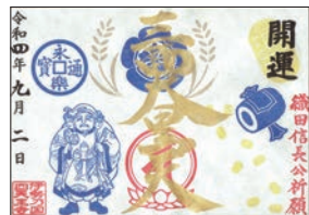
「季節限定の三面大黒天」の御朱印(9月)

このお寺の御朱印は、「聖徳太子1400年」季節限定の三面大黒天「葉師如来」「三面大黒天」の4種類があり、見開きの2面を使って季節の花などをあしらった