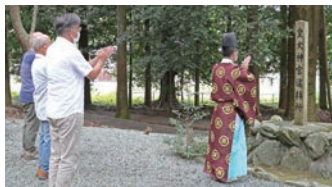
境内の一隅に神宮遥拝所

地区の氏神様に親しみを持ってほしい、また町外の人にも三瀬谷神社に足を運んでもらう機会をつくりたいと、数年