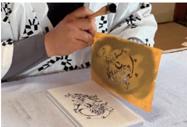
1枚刷り終わるたびに少しずつ完成に近づく