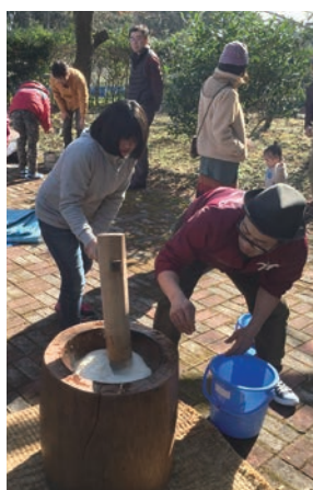
「昔ながらの餅つき体験」※

での作業体験を定期的に行っています。ジャガイモ・サツマイモ・ピーマン・オクラなど、季節ごとの野菜の種まきに始まり、除草や堆肥作り、収穫体験など、1年を通して盛りだくさんとなっています。