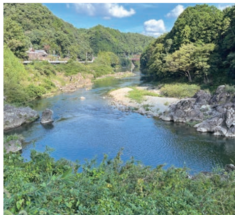
カーブの中頃に不動院が見える