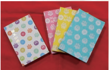
御朱印帳の表紙も色彩豊か

うです。北金井周辺地域は、今では閑静な住宅地や畑が広がりますが、当時は洪水や飢饉が頻繁に起こっていました。そのため、北金井・西方・大泉・東一色の住民たちが、五穀豊穰と地域の安全を祈願して、皇大神宮・豊受大神宮・伊勢神宮を祀ったのが始まりです。承久3(1221)年のことでした。その後、焼失して廃社となった時期もありましたが、住民たちの要望が実り、宝暦11(1761)年に再建されました。明治時代に春日社や金蔵社が合祀されて現在に至りますが、創建以来、ずっと