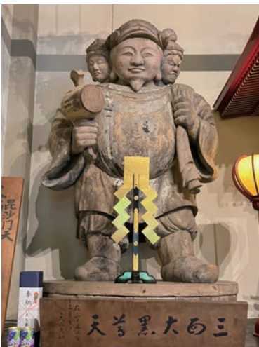
本堂にお祀りされている「三面大黒天」