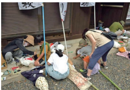
「昔ながらのカカシを作ろうよ!」※