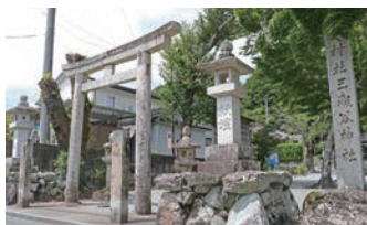
佐原地区の住宅街にある

明治時代には周辺地域の神社が合祀され、今日の三瀬谷神社となりました。本殿は天台町大字菅にあった、素賀神社から移築されたとされ、平成22(2010)年の登録有形文化財に選定され