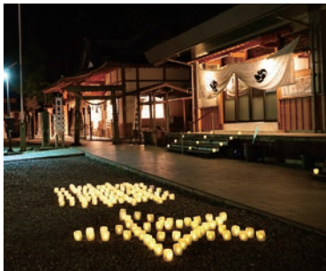
「相差・神あかり～石神さん夜参り～」のようす※