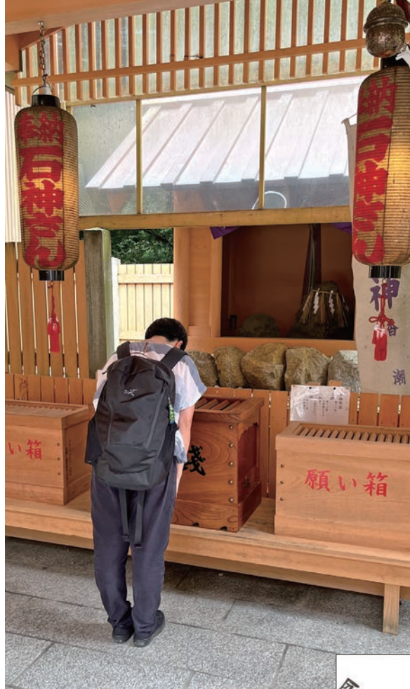
石神さん。では祈願用紙も用意され、願いごとを1つだけ書くことができる