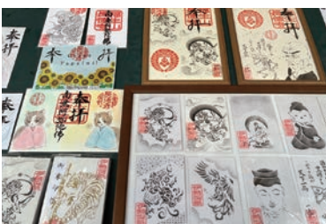
多彩な絵柄の中から選ぶのも楽しみの一つ