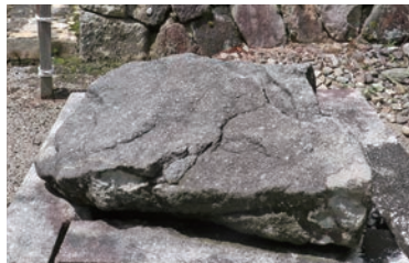
雨と豊作を願った「雨乞石」