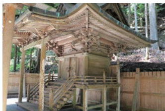
本殿は国の登録有形文化財