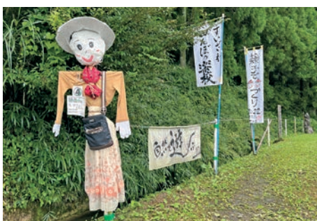
古着などを再利用して作られたカカシ