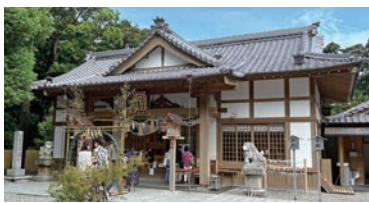
本殿には天照大御神を主祭神に26柱の神様が祀られる。

を中心に地域を盛り上げようとする取り組みも盛んです。その一つが「相差神あかり」石神さん夜参り。相差海女文化運営協議会・相差DMOが企画・運営する満月と新月の夜限定の夜参りイベントです。当日は参道のライトアップ、提灯の貸し出しなどがあり、神社や周辺の施設も夜間営業をしています。また夜参り限定の御朱印も用意されています。満月の日には満月、新月の日には新月のモチーフが描かれた伊勢和紙の台紙に貝紫色の御朱印が押印され特別感があります。