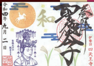
「聖徳太子」の御朱印(9月)