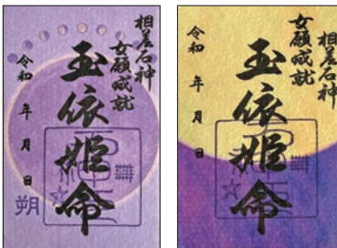
新月(左)と満月(右)の御朱印