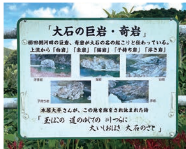
岩の名前が書かれた案内板

川が大きく左にカーブしていく途中に、歩道が川に張り出した部分があり、ここからの景色は絶品。赤岩・白岩・猫岩・浮岩など、岩の名前などを記した案内板が設置されていますので、ゆっくり見比べてください。