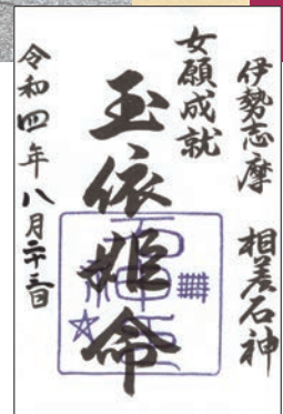
神明神社の御朱印