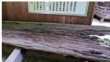
用水路に使われた「かけひ」

天照皇大御神ほか14柱を祀り、現在の美波多神社となりました。境内には天からの雨の恵みと豊作を祈ったとされる「雨乞石」が置かれています。日照りが続くくと近くの田んぼにこの石を沈め、焚き火をして雨乞い神事が行われたと伝わります。稲作に関する感謝と祈りの象徴が、境内にもう一つ。用水路の樋に使われた「かけひ」です。通水の無事を祈願し、神社の大木をくり抜いて使われていたそうです。新田水路は現在の伊賀市高尾にある水源地から新田まで、約14キロにおよぶ用水路。この水路の中間部に川を横断させなければなら