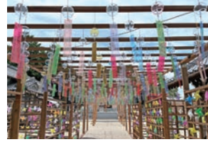
境内を彩る風鈴と風車