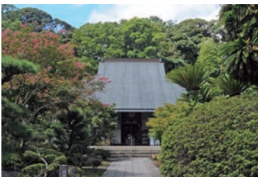
本堂には多くの仏像が並ぶ