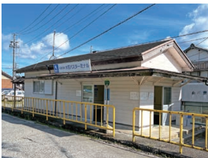
駅舎の面影を残す「大石バスターミナル」

に指定されており、脇には石に刻んだ馬頭観音も祀られています。再び川に沿って進み、波多瀬橋の前を過ぎると、ゆるやかなカーブの向こうにゴールの「大石」バス停・「大石バスターミナル」が見えます。ここは昭和39(1964)年まで、松阪駅と大石を結んでいた松電(松阪軽便鉄道)の終着駅跡。時代を追って交通手段が変遷しているのを実感しながらのゴールです。 ※バスは本数が限られていますのでご注意ください。