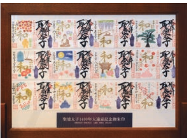
御朱印は毎月絵柄が変わる