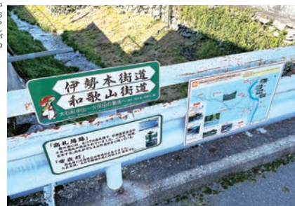
矢下川に架かる大石橋

さらに進むと、道はまた166号と交わり、信号のある「大石」交差点に出ます。ここを渡って坂を上り、さらに旧街道を進むと、矢下川 やしろがわ にかかる大石橋の手前に四つ角があります。この辺りが昔の大石宿の中心地。この付近に、かつて本陣や30頭も馬がいたという伝馬所などがありました。また、旅人に藩の決まりなどを告げる高札や、灯りをともしして旅の安全を守る常夜燈などもあったそうです。現在、常夜燈は後に立ち寄る不動院にあり、高札は、今回のコースには入っていませんが、ここから300メートルほどの地点にある蓮浄寺に保管されており、あらかじめお願いしておけば見学可能とのことです。