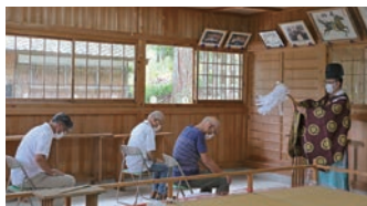
月次祭に参列する総代