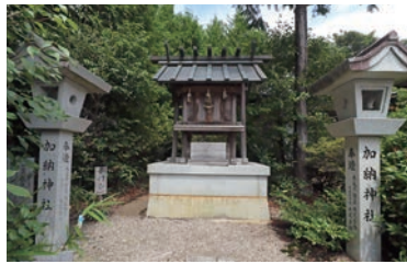
地域の恩人を記る加納神社

年)に開発された新田村に、当時入植した村民が三柱神社を氏神として勧請しました。その後、開発の恩人である加納藤左衛門直盛公の遺徳を顕彰するために、没後54年目の享保16(1731)年に加納神社を合祀。地域の恩人に対する信仰は今でも篤く、熱心に手を合わせる参拝者が絶えません。毎年12月7日には、功績を偲び、加納祭(偉人祭)を行い、感謝し続けています。その後、明治43(1910)年に村内の東田原九頭神社、中村國津神社、小波田福田神社が合祀され、