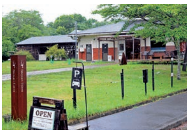
「いのさん農園」の入口