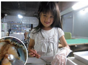
貝の中から真珠を取り出す※