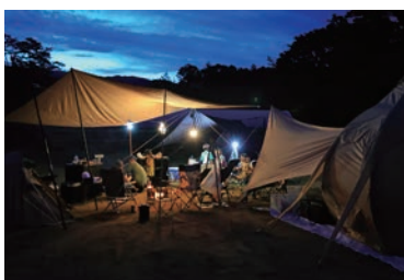
キャンプ場で楽しい夜を※