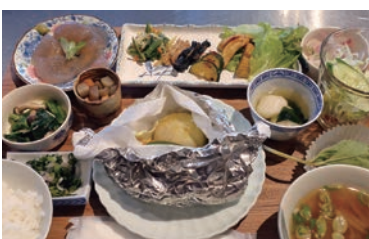
品数の多さにも驚くランチは1000円(左一番奥が藁灰こんにやくの刺身)※