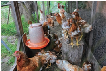
ゴトウモミジは元気な鶏