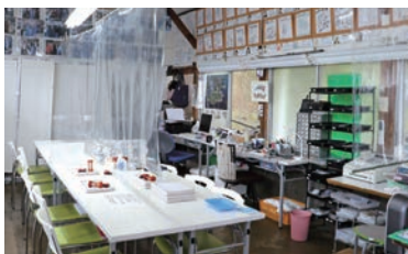
工房内に専門の器具が並ぶ