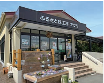
「ふるさと味工房 アグリ」