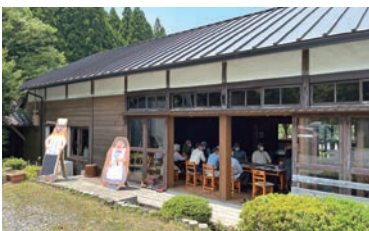
旧中学校分校の木造校舎を再利用した「ハナレ」