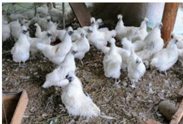
おとなしい烏骨鶏