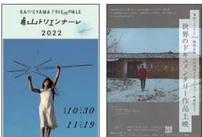
「亀山トリエンナーレ2022」

平成25(2013)年まで毎年開催し、平成26(2014)年からは「亀山トリエンナーレ」として3年に一度開催しています。今年も10月30日から11月19日まで、いろいろな企画が行われます。私は実行委員会の事務局長兼ディレクターですが、「マジヨプラス」のメンバーも全員参加・協力してくれます。