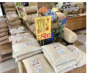
「別館 米工房」では地元米を販売