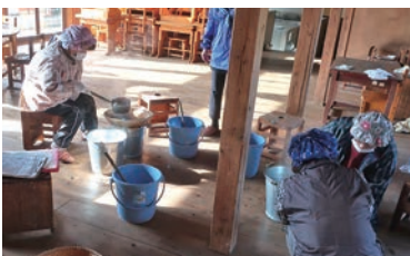
おいしい藁灰こんにやくを作るため、黙々と作業する皆さん※