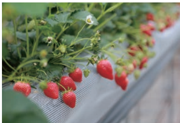
旬には食べ頃のイチゴが並ぶ※