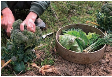
季節の野菜を収穫※