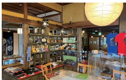
「熊野古道おもてなし館」