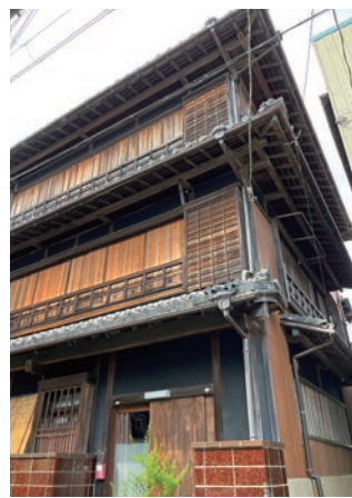
木造3階建ての邸宅

右折して路地を抜けると左に鳥居が見えてきました。氏神の木本神社で、10月には、暴れ神輿の異名をもつ例大祭が行われます。木本町の各地区から山車が出て、神輿のお供をしながら町内を練り歩き、子どもたちが白塗りに隈取の化粧をする六方行列も賑やかです。鳥居横には吉田庄太夫を祀る吉田大明神石碑があります。安政2(1855)年徳川御三家の紀州藩直轄から、新宮城主・水野氏に知行替えが公布されると、税が重なることを恐れた木本側で反対騒