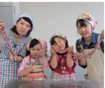
ソーセージ作り体験※

まな料理で味わえます。少し離れた「別館 米工房」では玉城町産の米や餅、地元食材を使った惣菜などを販売。まさに玉城町の「食の魅力」が凝縮された施設なのです。