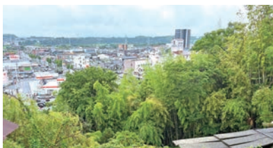
眼下に緑と街並みが広がる

森：まち・人・アートが混じり合える場所にしていきたいと思い、平成20(2008)年に「アート亀山」を企画しました。たくさんの方のご賛同とご協力を得て、