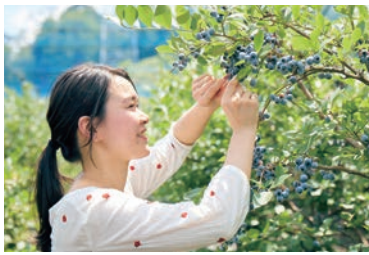
採りたてのブルーベリーは格別の味わい※