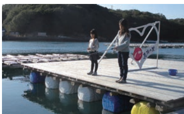
静かな英虞湾で魚釣り※