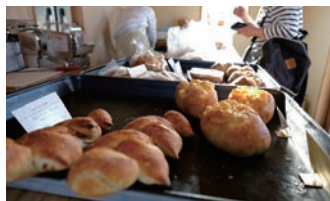
「パン焼き小屋 土の香」店内風景※