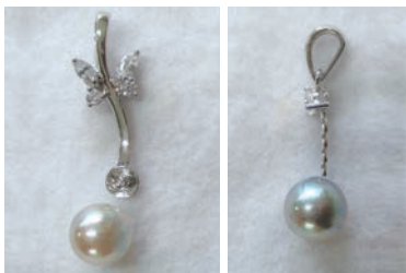
アクセサリーに加工※