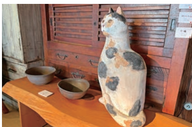
作品の個性が響き合う展示