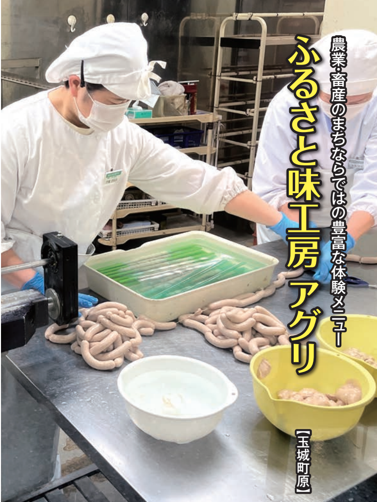
玉城豚は枝肉で仕入れ、アグリで整形・加工される

伊勢自動車道・玉城ICから車で約10分。「アスピア玉城」は、緑に囲まれた静かな環境の中にある町営の観光公園です。地元の新鮮な農畜産物を販売する「ふるさと味工房 アグリ」、玉城弘法温泉のある「ふれあいの館」を中心に、敷地内には自然観察や森林浴を楽しめる広場や遊歩道が整備されています。春は散策しながらお花見が、夏はひまわり、秋はコスモスなど四季折々の花々も楽しめます。地元の人や観光客でいつも賑わっています。