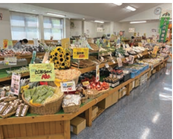
朝採れの野菜が並ぶ