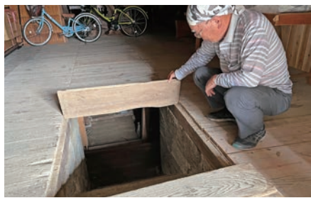
旧枋尾邸の蔵の地下