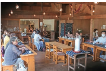
「ハナレ」でのランチ風景※