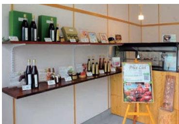
直売所「ヤマノウエ」内部