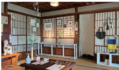
作品を飾った和室