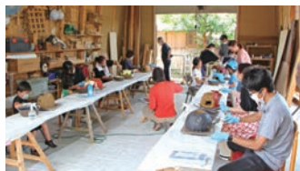
ミニかまどづくりに没頭する参加者たち