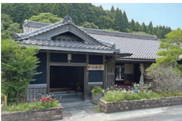
古民家を改装した「二瀬屋」