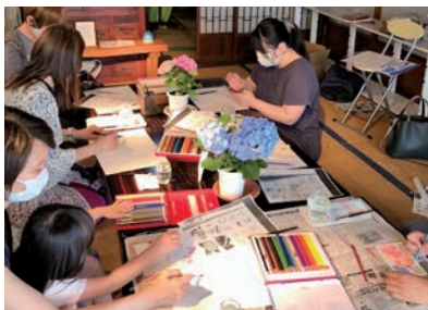
ワークショップも楽しく*