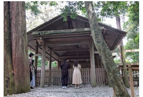
第一別宮の多賀宮