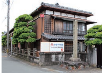
「伊勢和紙館」の入口