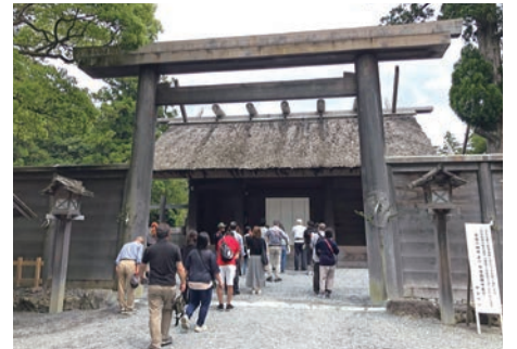
芭蕉も参拝した御正宮