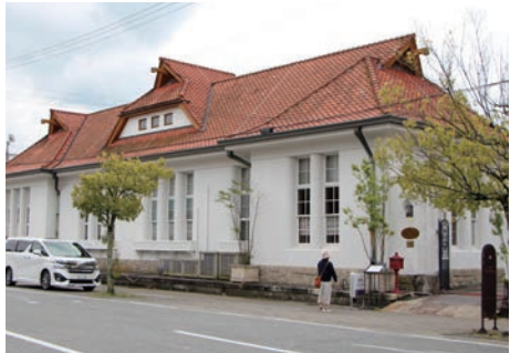
「旧山田郵便局電話分室(通信館)」