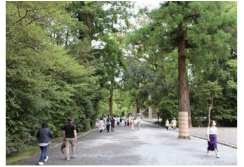
外宮の表参道。杉の大樹が多い