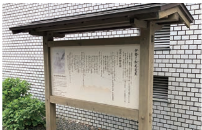
「伊勢と松尾芭蕉」の案内板

段を上がると第一別宮・多賀宮です。石段を上りきった左、手すりの下に寝地蔵と呼ばれる自然石があります。