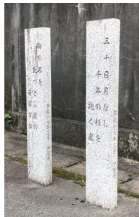
二つの句碑が並ぶ

和紙工業株式会社」の塀の前には、「三十日月なし千年の杉を抱く嵐」物の名を先ずとふ蘆の若葉かな」の二つの句碑が並んでいます。