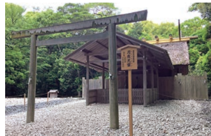
外宮別宮の月夜見宮