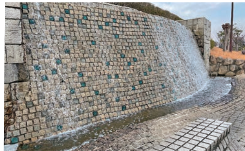
「水と緑のせせらぎ広場」

同8(1996)年度にかけて整備され、「水と緑のせせらぎ広場」となりました。同広場の延長は約900メートルありますが、歩くにつれて風景が変化するため、飽きることがありません。また、すぐ近くの県道を走る車が視界に入らないため、ウォーキングや犬の散歩を楽しむ人々が行き交います。北端まで歩けば、「富田一色けんか祭り」で名高い飛鳥神社は徒歩数分の距離。ここも見逃せない場所です。「富田一色けんか祭り」とは、