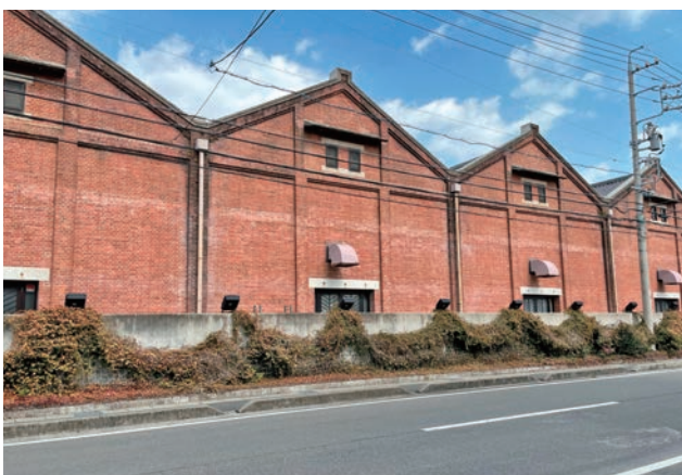
旧東洋紡績株式会社 富田工場 原綿倉庫 (国登録有形文化財)

さて、今回は四日市港をめざすため、駅の東口から出て、南東へと進みます。すると、レンガ造りの建物群が現れました。三角形の屋根が印象的な建物は、「旧東洋紡績株式会社 富田工場 原綿倉庫」です。「東洋紡績株式会社」は、四日市の事業家・伊藤 伝七(でんしち)が創設した「三重紡績会社」と、「大阪紡績会社」が大正3(1919)