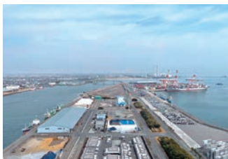
「うみてらす14」から北東方向を望む