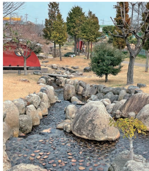
鈴鹿山脈を源とし、伊勢湾へ流れる川・運河をイメージ

8月14日・15日に行われる祭りでも、重さ100キログラムの大鉦を飛鳥神社に入れようとする組と、入れさせまいとする町衆の激しい攻防戦が見ものとなっています。