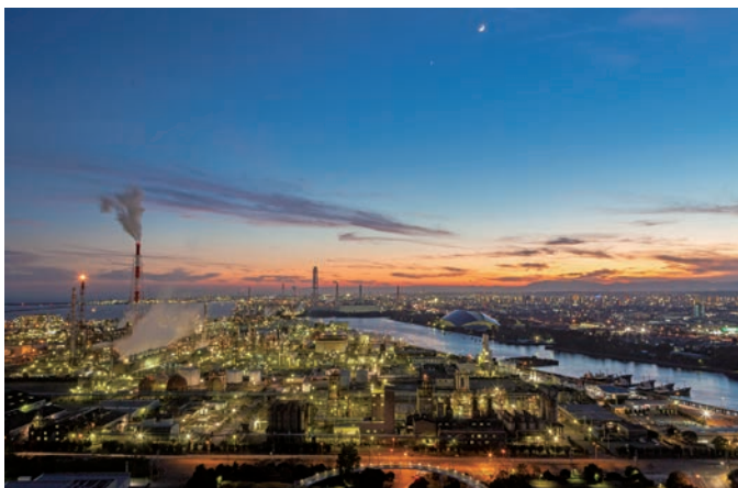
光とコンビナート群が織りなす絶景を堪能※

問 一般社団法人 四日市観光協会 TEL 059-357-0381 四日市港管理組合振興課 TEL 059-366-7022