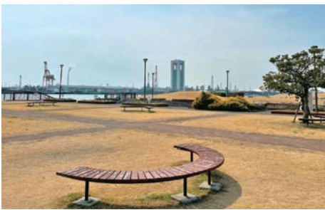
「富双緑地」からの眺め

同緑地でくつろいだ後は、「四日市港ポートビル」へ。途中、国道23号の歩道を5分ほど歩くため、車に十分注意しながら進みます。「浜園緑地」の中を通り