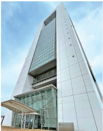
高さ100メートルの「四日市港ポートビル」

同緑地でくつろいだ後は、「四日市港ポートビル」へ。途中、国道23号の歩道を5分ほど歩くため、車に十分注意しながら進みます。「浜園緑地」の中を通り