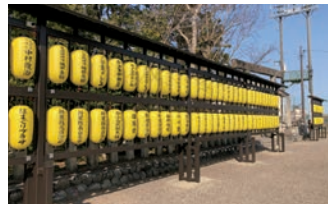
黄色い提灯が華やかな境内