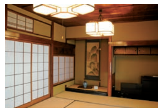
「鶴の間」は落ち着いたたたずまい

武家の町に豪商が建てた家。長い年月を経て、多くの市民や旅人の思い出の舞台となりました。文化財の中で食事や宿泊ができる数少ない場所です。