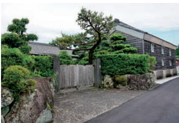
ヒノキ製の正門は石積みも立派 ※