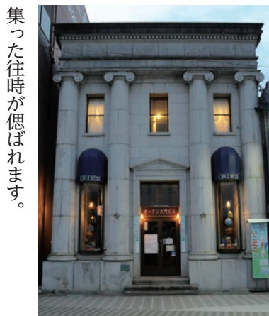
窓に灯が点ると一層ロマンチック