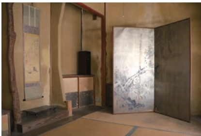
「臯月寮」は4帖間の茶室建築