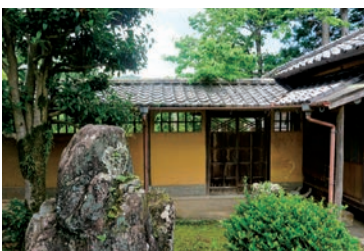
南蔵へと続く渡り廊下 ※