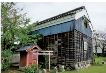
稲荷社と江戸末期の南蔵 ※