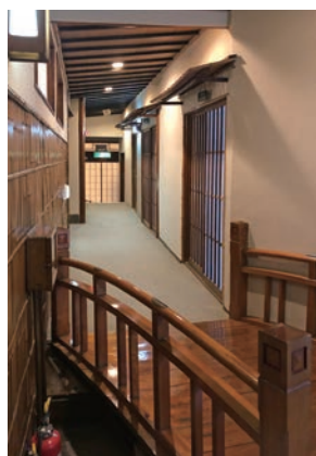
街道の雰囲気を取り込んだ廊下

また、「玄関棟」の南側に立つ「鶴亀棟」は、10畳の「鶴の間」と8畳の「亀の間」の二間続きの平屋で、本来は庭の奥にありましたが、現在の位置に曳き屋を行って移動したそうです。主の書斎として使用されていた建物で、小津家の別邸だった頃の雰囲気が最も多く残っています。長い廊下の長押が継ぎ目のない一本の材であったり、書院脇に家紋を彫り込んだ繊細な欄間があったり、ぜいたくな造りでありながら品の良いのが印象に残ります。