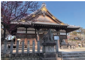
鎮國守國神社 本殿