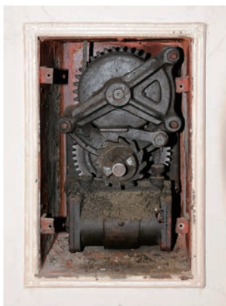
シャッターのカムは今も健在

現在、2階は使用されていませんが、夕暮れ時、窓に灯が点ると、装飾のロマンチックさが際だって、華やかに人々が