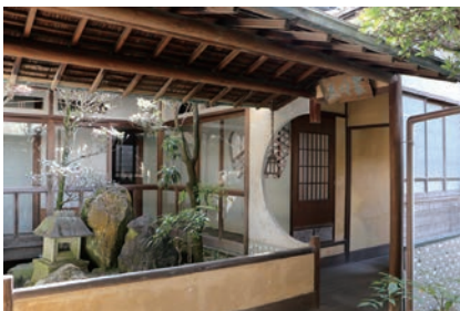
渡り廊下でつながる「翠明荘」