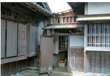
使用人の部屋の入り口上に無双窓 ※