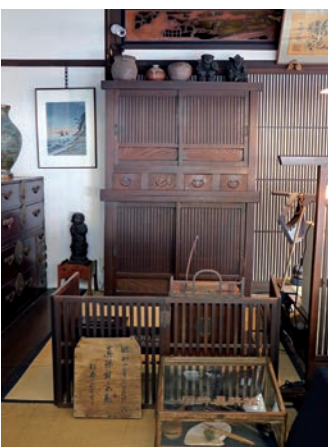
帳場の雰囲気そのままと展示

店のショーケースに並ぶのは、アンティーク調で独創的なオリジナルジュエリー。商品の一つひとつに高い品質を誇り、老舗としての責任の上に努力を重ねています。質とデザイン性が高く、年配から若い方まで全国のファンの支持を集めています。