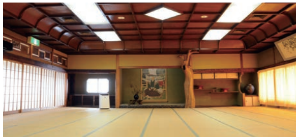
大広間 大きな床の間に立派な掛け軸が似合う