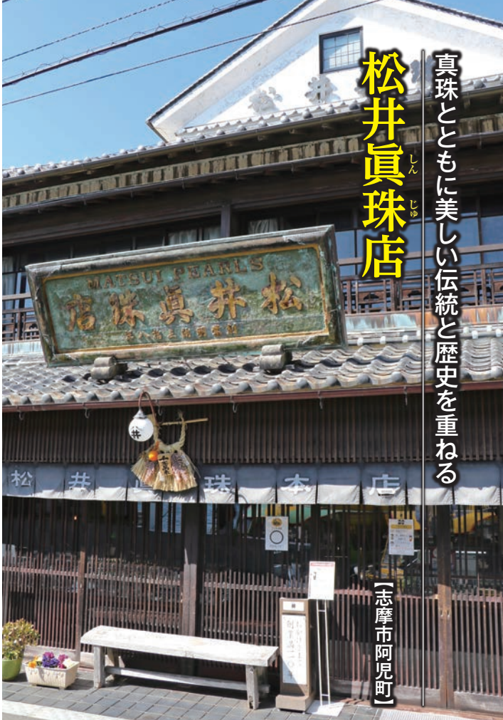
格調高い店舗正面。昭和4(1929)年頃の建築