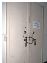
金庫の頑丈な鉄の扉

「昭和59（1984）年に私の父がここを買い、毛糸店を開いていました。戦争を乗り越えてきた建物ですので、「銀行だった頃、ここに勤めていた」『近所に住んでいて、戦争中荷物を預かってもらった』など昔の思い出話を聞くことも多く、たくさんの方の思い出詰まった建物なのだと思えました」。