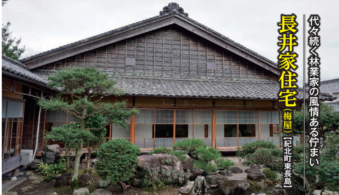
江戸末期の主屋と内堀によって囲まれた閑静な中庭 ※