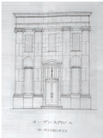
調査の際描かれた正面図