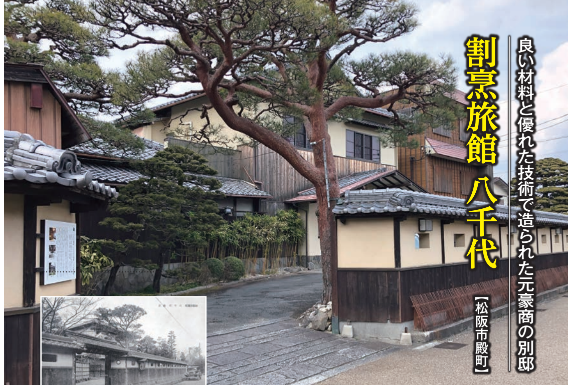
八千代 前景 昭和10年頃の写真とほぼ変わらない

松阪市殿町は、城跡の石垣の下に広がる住宅街。古い邸宅の生垣や門が続く静かな町並みです。その一角に立つ「割烹旅館 八千代」は、大正初期創業という老舗料理を主とする料亭で旅館業も行う、今では少なくなった料理旅館です。