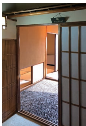
部屋ごとに違う意匠が凝らされている