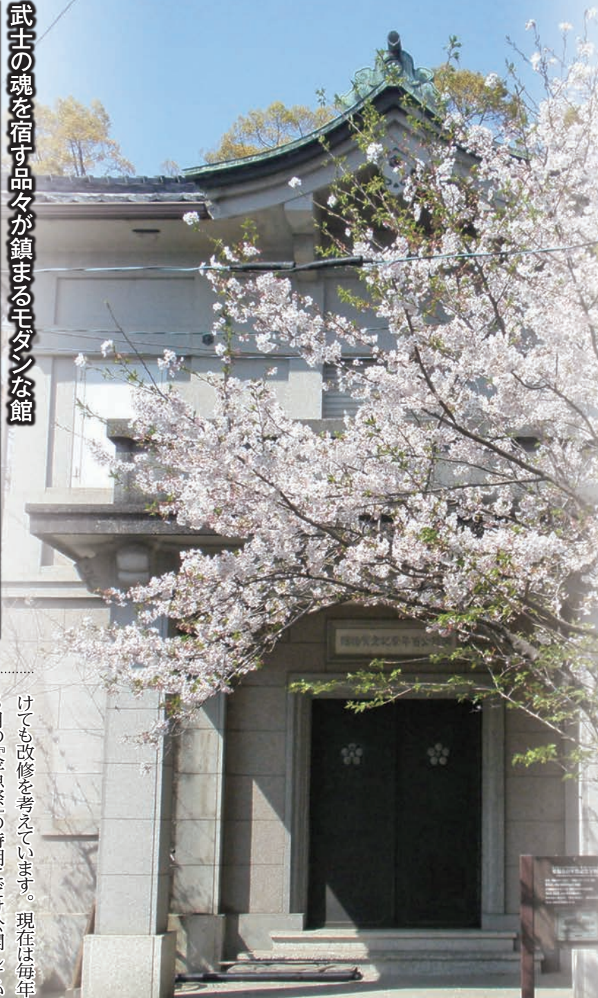
武士の魂を宿す品々が鎮まるモダンな館

取材・文……中村元美・堀口裕世 *各登録有形文化財の開館日時・受け入れ方法・料金などはそれぞれに異なり、変更になる場合もありますので、必ず事前にご確認ください。