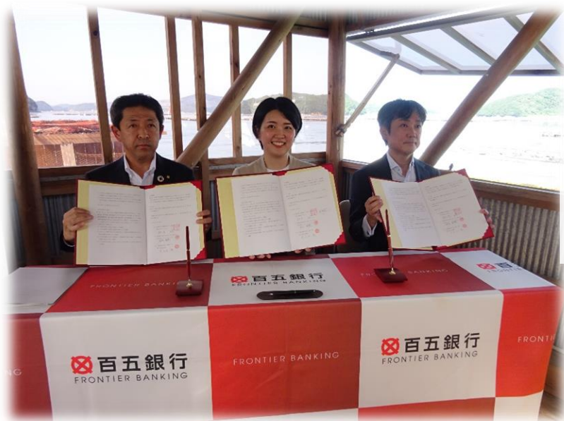
海上牡蠣小屋での協定調印式 (鳥羽市内)