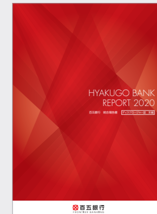
統合報告書 (7月に発行)

また、銀行法第21条に基づくディスクロージャー誌(資料編)は、毎年7月と1月に発刊しています。当行ホームページをご覧ください。