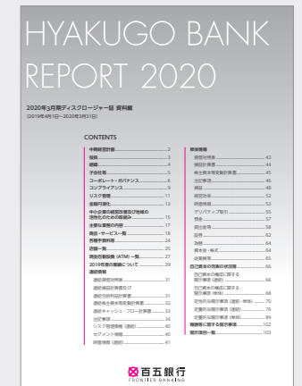
資料編 (7月と1月に発行)