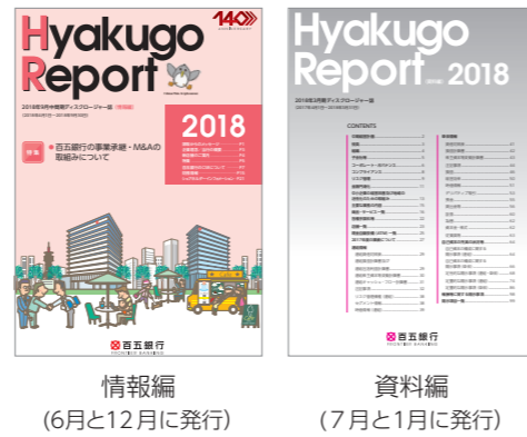
情報編 (6月と12月に発行)

なお、最新版のディスクロージャー誌(情報編)は、各営業店の窓口にご用意しています。また、資料編につきましては、ホームページをご覧ください。