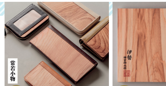
第1弾 御山杉の名刺入れ、財布

※御山杉とは 伊勢神宮の神域内で保護されていた杉。台風などで倒れたり、枯れて参拝客に怪我をさせる可能性がない限り、切り出されて市場に出回ることがない貴重な銘木です。