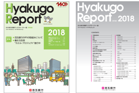
情報編 (6月と12月に発行) 資料編 (7月と1月に発行)

特に情報編は、CSR活動などについても掲載し、当行の活動を広くご紹介するとともに、見やすさも意識した内容としています。