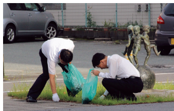
▲ 日本列島クリーン大作戦

昭和57年以来、「小さな親切運動本部」の呼びかけに応え、日本列島クリーン大作戦に参加して、全行をあげて取り組んでいます。また、毎年9月に実施される「津市民清掃デー」にも参加し、阿漕浦海岸の清掃などを行っています。