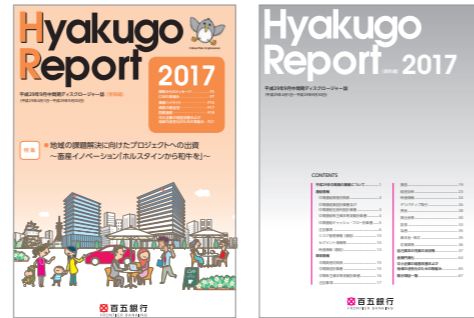
情報編 (6月と12月に発行) 資料編 (7月と1月に発行)

特に情報編は、CSR活動などについても掲載し、当行の活動を広くご紹介するとともに、見やすさも意識した内容としています。