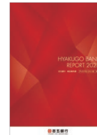
統合報告書 (6月に発行)

また、銀行法第21条に基づくディスクロージャー誌(資料編)は、毎年7月と1月に発行しています。当行ホームページをご覧ください。