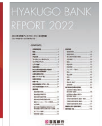
資料編 (7月と1月に発行)