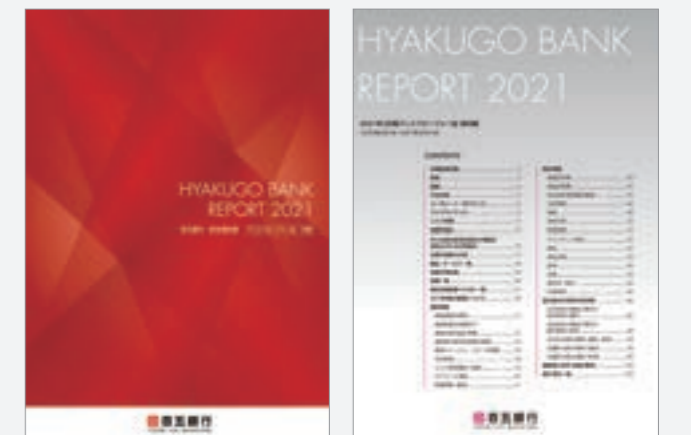
統合報告書 (7月に発行)

また、銀行法第21条に基づくディスクロージャー誌(資料編)は、毎年7月と1月に発刊しています。当行ホームページをご覧ください。