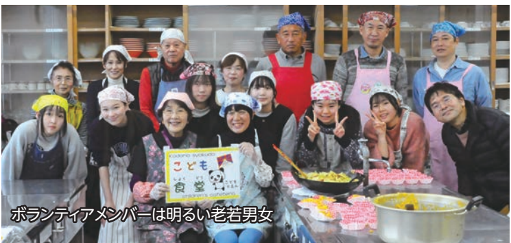
ボランティアメンバーは明るい老若男女

ているとのこと。「ご寄付の申し出が多いのには本当に感謝しています。コロナ禍の影響で、みんながわいわいと食えることや、絵本の読み聞かせなどできない部分もありませんが、居心地のよい場所づくりをめざして、ずっと続けていきたいです」。これからも毎月、明るい笑い声が響いていくことでしょう。