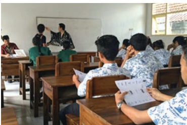
海外で「古代文字」の授業※