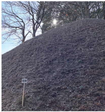
椎ノ木城跡の切岸は見上げる高さ