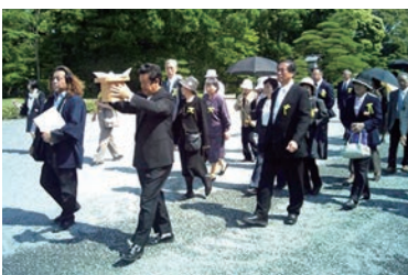
2万人誘客プロジェクトで神宮参拝※