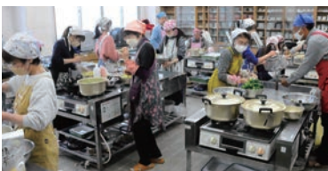
賑やかな調理風景