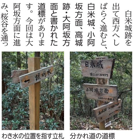
わかき水の位置を指す立札 分かれ道の道標

白米城跡を出て西方へしばらく進むと、白米城、小阿坂方面、高城跡・大阿坂方面と書かれた道標があります。今回は大阿坂方面に進み、桜谷を通って下山します。すぐそばに立札がある「銀明水」は、下の谷にあるわき水を示しているようで、「季節によって少し水が湧く程度です。神明水の伝承もありますが、今は分からなくなっています」とのこと。