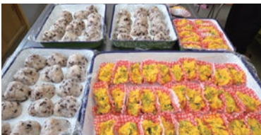
人数分をきれいに並べて