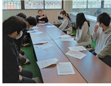
ボランティアスタッフとの打ち合わせ