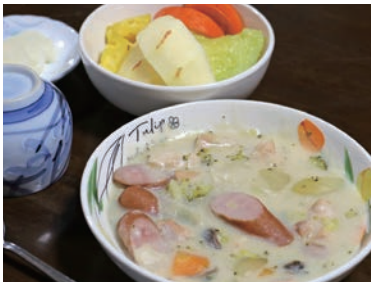
シチューは人気メニューの一つ