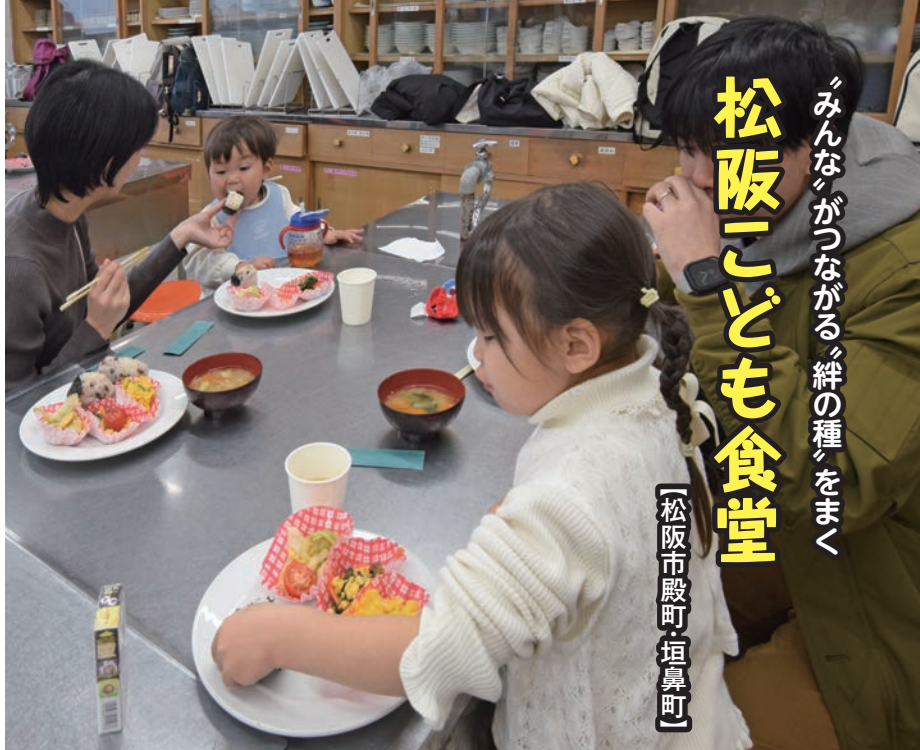
「みんなで食べると美味しいね」とおにぎりにア～ン

「松阪子ども食堂」では、毎月第3土曜日の12時30分から松阪市福祉会館で開かれるイートインと、第1金曜日14時30分