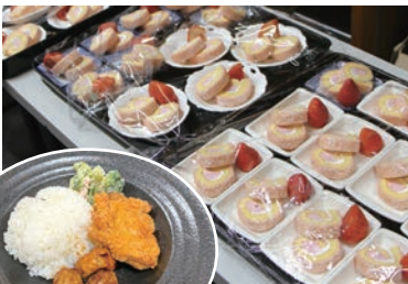
季節に合わせた彩り豊かな食事