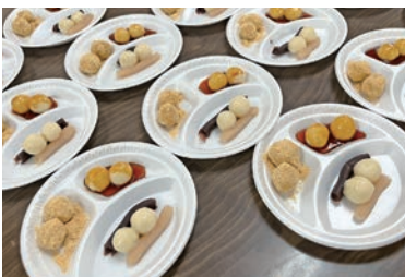
お団子は4つの味で