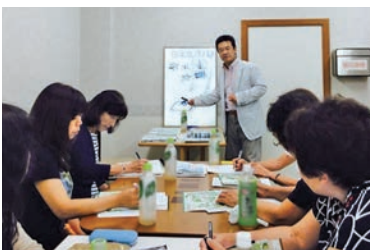
「伊勢志摩おもてなし案内人」の養成講座※