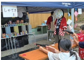
「やまっこ夏祭」には60人が参加※

ひとときを提供しました。1周年の記念イベント「やまっこ祭」では、熊野市社会福祉協議会や木本高校の協力も得て、射的などのゲームコーナーを設け、スパーボールすくいや昔ながらの遊びを楽しんでもらいました。