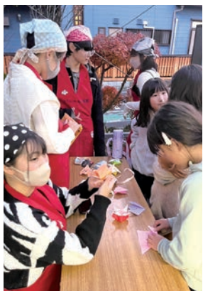
子どもたちに折り紙を教える高校生スタッフ※

この日は、食堂開始時刻の1時間前に訪問しましたが、すでに大勢の子どもたちで賑わっていました。退屈しないように折り紙を教えたり、クイズを出題して謎解きを楽しんでもらっているのは、ボランティアスタッフの高校生。中に