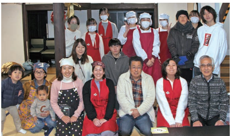
「羽津地区まちづくり推進協議会」の皆さん

世代間交流など。会の活動拠点でもあるサロンでは、曜日別に子育て支援の会による「遊ぼう会」や、健康体操・健康相談会などを実施。加えて第1・第3金曜日には高齢者食堂「さんきゅう食堂」も