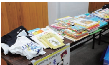
子ども服や絵本などの提供も