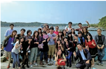
「JENESYS」で台湾からの訪問※