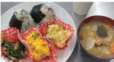
この日のメニュー