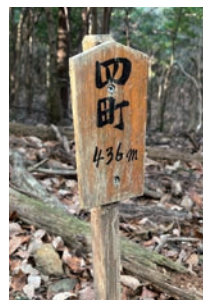
一町ごとに表示が