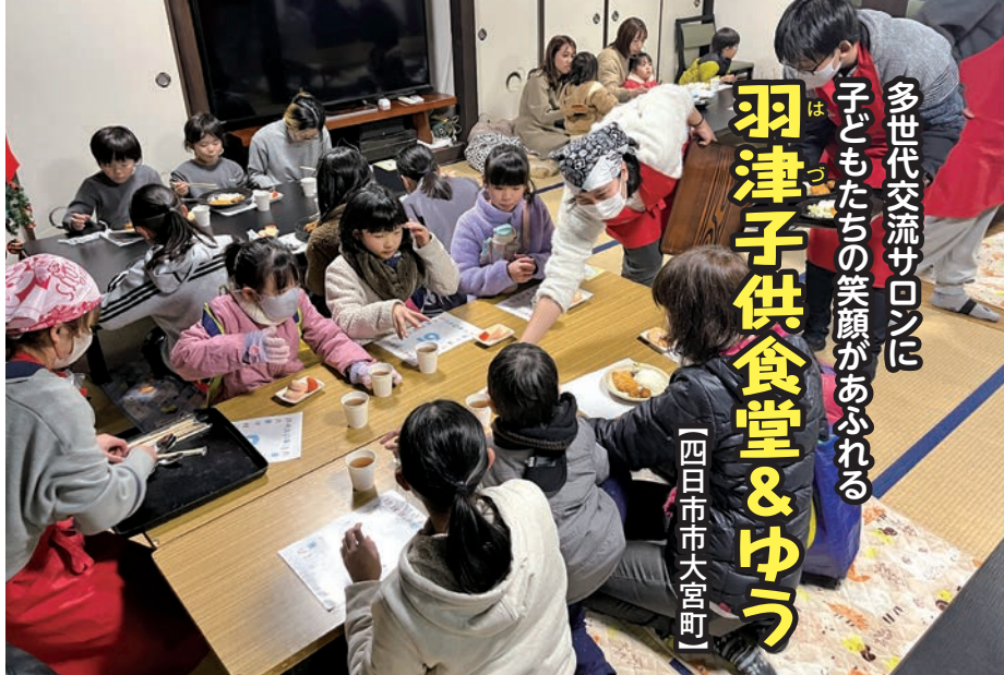
「羽津子供食堂&ゆう」の食事風景

れているのが志氏神社。4世紀築造と伝わる前方後円墳や、神様に足を折られた話が語り継がれる狛犬など、数々の文化財を有していることでも知られます。