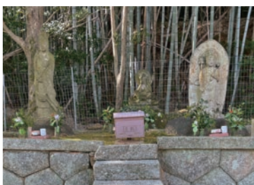
三体の観音像がある鳥岡観音