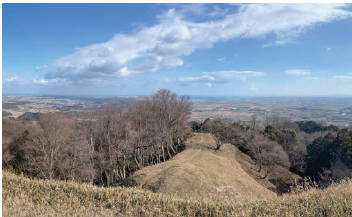
白米城跡(南郭)から地獄谷方向を見下ろす