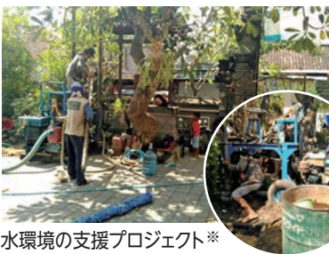
水環境の支援プロジェクト※