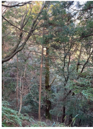
谷底から伸びている大杉

登山の安全を祈って、登山口へ。山に入っすぐは、道幅は広いのですがかなりの急勾配。道が細くなる付近からは少しなだらかな道になります。1町(109メートル)ごとの表示や、「頂上