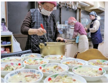
お皿に均等に盛り付ける

職員や調理スタッフも一緒に食事をし、「おかわりもあるよ」「全部食べたの、偉いねえ」「よく噛んでね」「まだ残ってるよ」と普段は親が気にすることも声を掛けるので、子どもとしっかり向き合っ